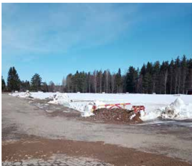
Huhtikuussa 2023 töiden jatko odottaa alkamistaan.