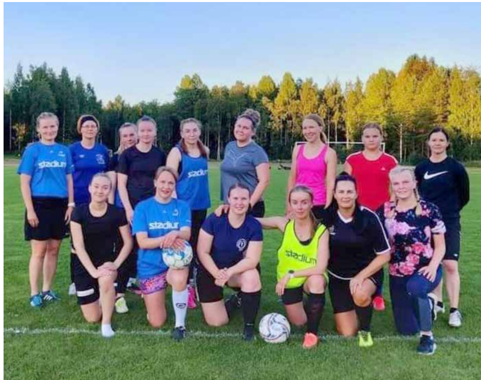
Kesällä 2022 Fc Aidot Helmet vieraili Pielaveden urheilukentän sametilla

Fc Aidot Helmet