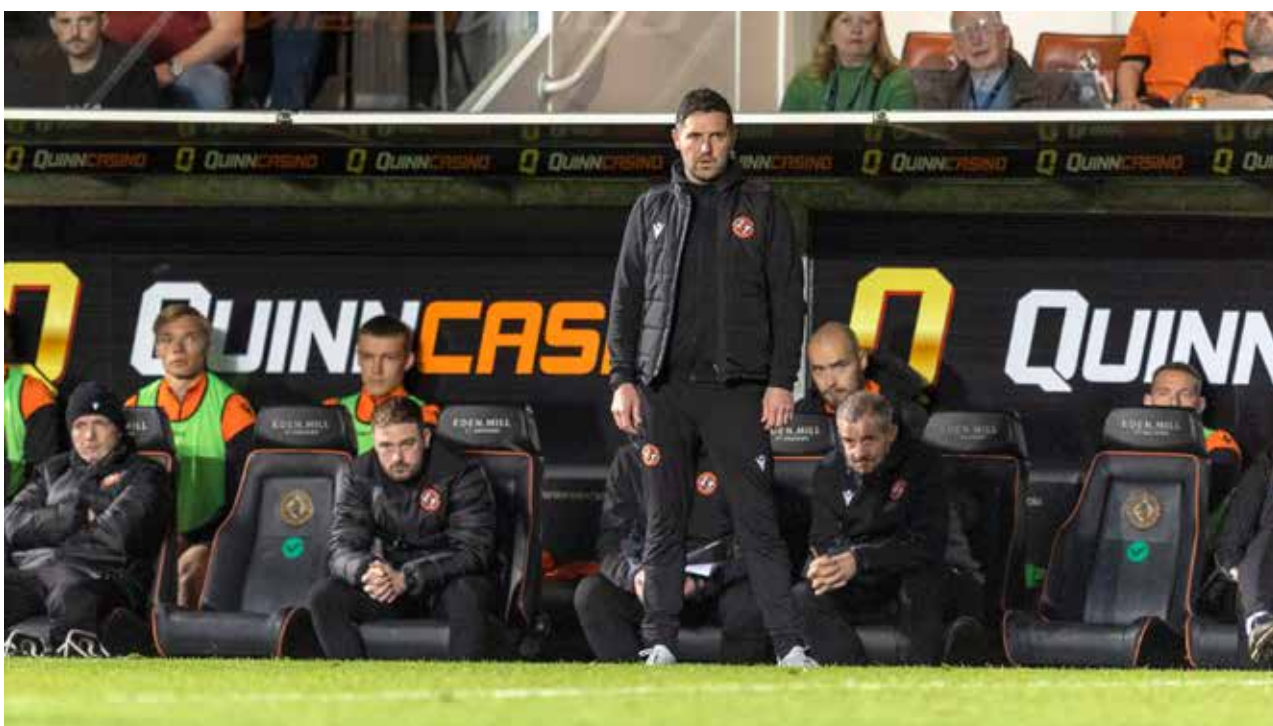
Liam Fox`n kaudella kävi vaihtopenkki liiankin tutuksi

Palstatilan rajallisuuden - ja liiallisen jaarittelun välttämisen - vuoksi hypätään pikakelauksella muutama kuukausi etiapäin ja helmikuun neljänteen päivään. Edellisestä ysikymppisestääni Unitedin riveissä on vierähtänyt kevyehköt yhdeksän kuukautta, marraskuulta löytyy toki Huuhkajien paidassa ysikymppinen harjoitusmaaottelussa Norjaa vastaan, joka myös nosti toiveita - tosin turhia sellaisia - vastuun kasvamisesta seura-joukkueessa, ja olemme