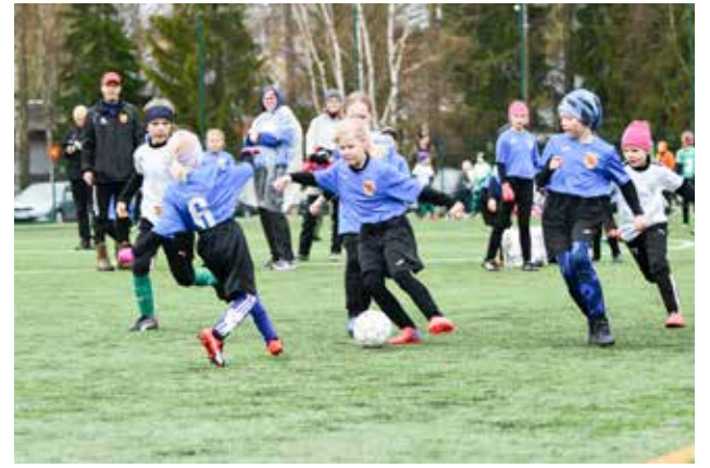
Sinä kyllä pyörähät! Kuvan perusteella vaikuttaa, että kiupalaiset harhauttelevat toisiaan.

Tulevalle kaudelle lähdemme pelaamaan 8v8 peliä. Pelaajat ovat tuttuja keskenään ja ryhmäytyminen on pidemmällä kuin edellisen kauden alussa. Olemme harjoitelleet talvella kerran viikossa. Valmentajakin on ehtinyt jo yhden kauden verran saada kokemusta valmentamisesta, joten joukkue lähtee alkavaan kauteen aiempaa valmiimpana. Tuskin valmiina kuitenkaan.