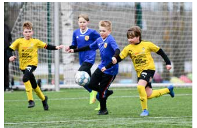
Myös kaudella 2023 väännetään KuPSia vastaan.