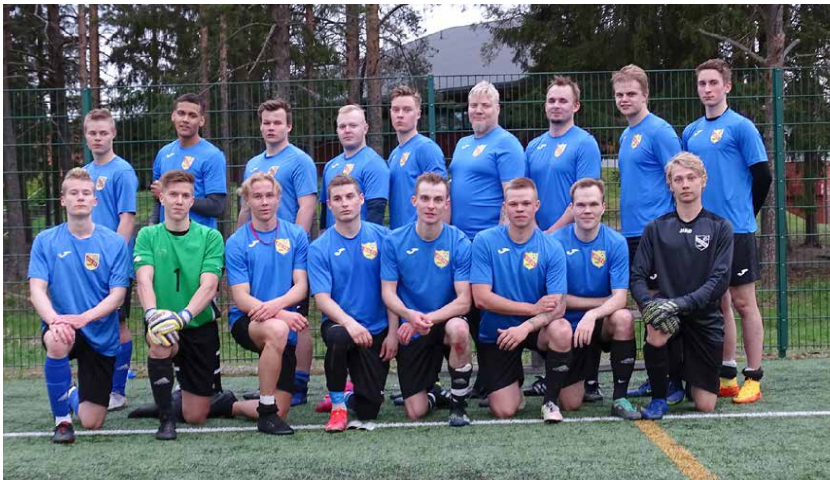
KiuPan miesjoukkueen osaamista ei valitettavasti kaudella 2023 päästä mittaamaan.

KiuPan miesjoukkue suuntasi kauteen 2022 jo useamman vuoden ajalta tutulla rungolla, myös muutamia tuttuja kasvoja aiemmilta vuosilta palasi joukkueen toimintaan. Viime kausilta tuttua yhteistyötä PK-37:n kanssa jatkettiin hyvässä hengessä, tämän avulla PK:n nuoret saivat arvokasta peliaikaa ja KiuPa vastavasti tärkeitä apuja jokaiseen peliin.