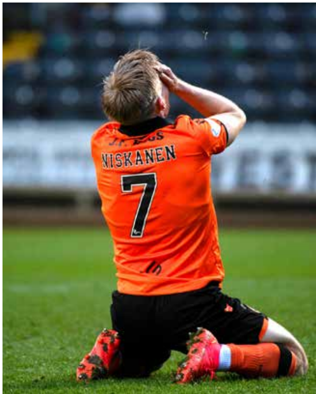
Yksi kuva kertoo koko kaudesta enemmän kuin tuhat sanaa.

Ja kohtahan se on jo kesäkin ja pieni loma, tosin suunnitelmassa on jättää lomailu minimiin eli aika tulee kulumaan erinäisten Kiuruveden erinomaisten liikuntapalveluiden parissa, pääpaik- kon ollessa luonnollisesti tekonurmen sametilla. Siellä törmäillään ja eiköhän tuota jonkunlaista kivaa ohjelmaakin kehitellä johonkin väliin. Joka tapauksessa jo tässä vaiheessa toivotan oikein menestyksestä ja ennen kaikkea ilon täyttämää pelikautta jokaiselle KiuPan jengille. Jalkapallo on nimittäin ihan kottalaisen nasta laji, naattikee ja muistakke myös laakasta.