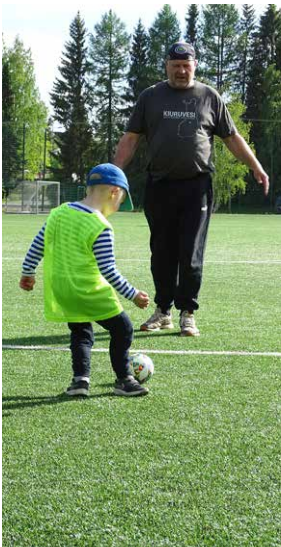
Futisseikkailussa lapsi voi touhuta vaikka ukkinsa kanssa.