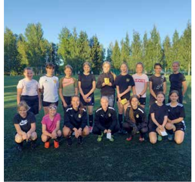
Joukkue oli viime kaudella mukana KuPS:n Tulevaisuuden tähdet ohjelmassa.

Teksti: Tiina Jauhiainen ja Jarno Laitinen