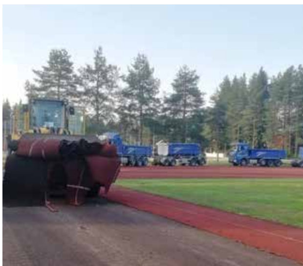
Korjaustyöt alkoivat kesällä 2022 pinnoitteiden poistolla