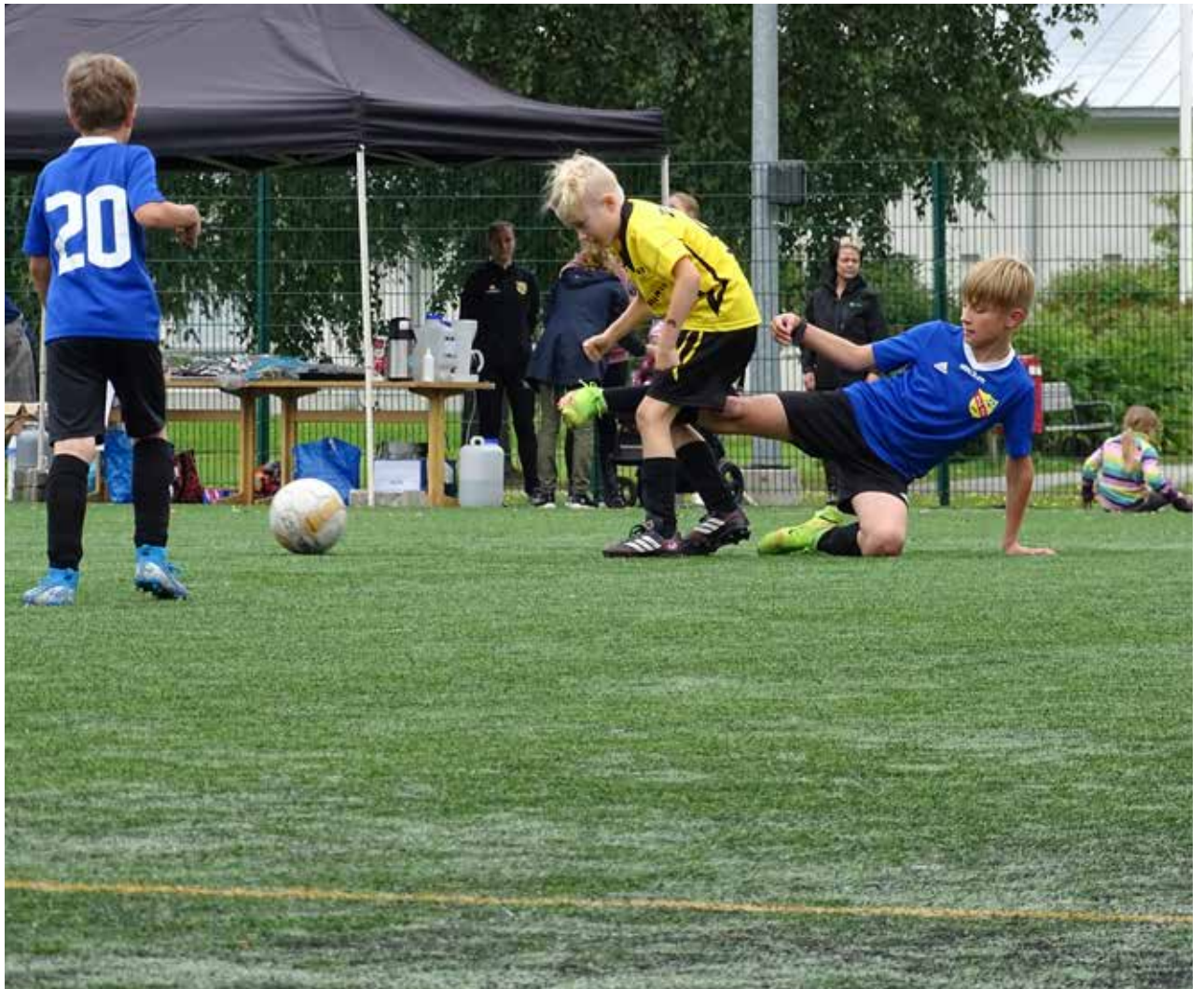
Tulevalla kaudella joukkue venyy ja paukkuu P11 sarjassa.

Teksti: Eveliina Pölkki