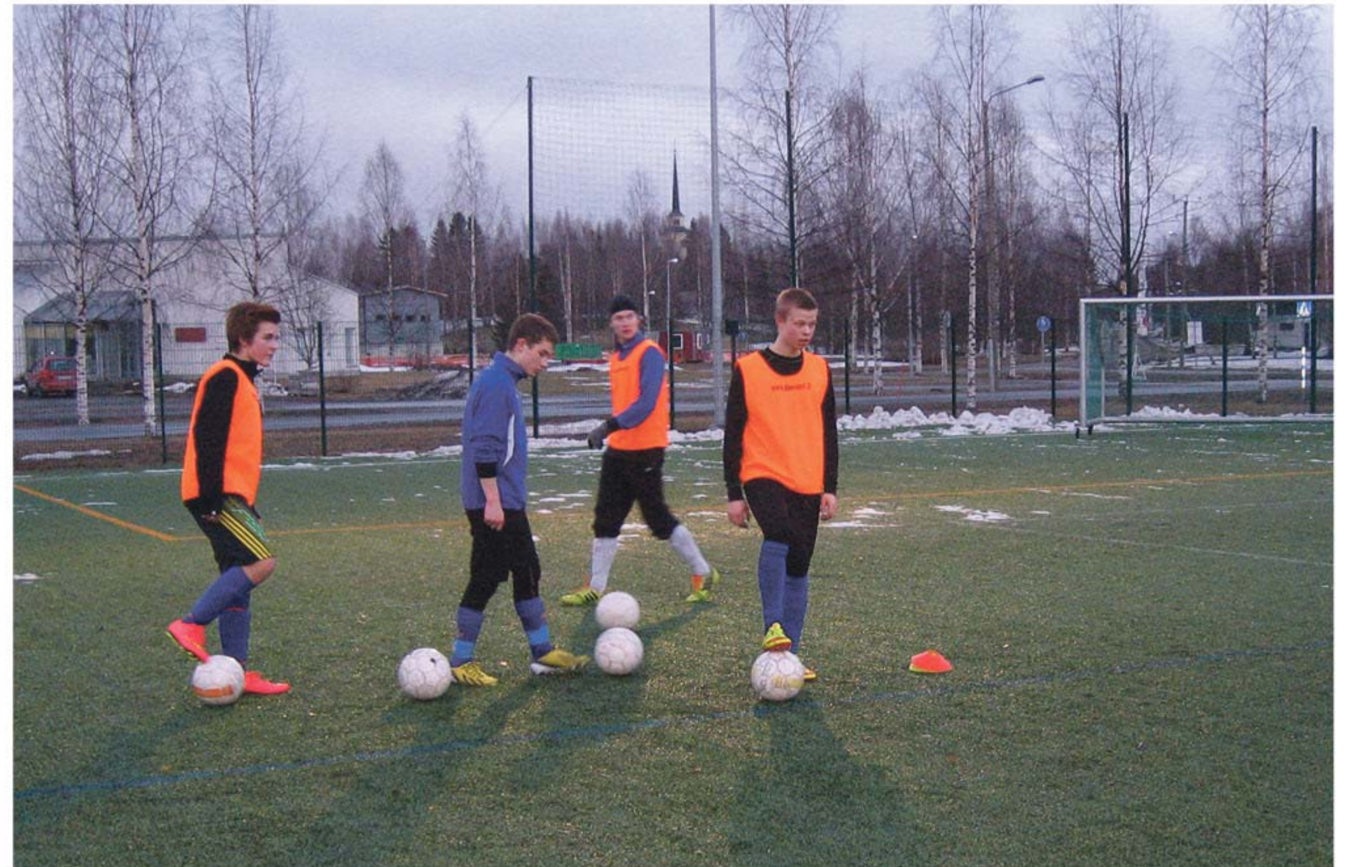
Viime keväänä miehet aloittivat ulkoarjoittelun 13.4.