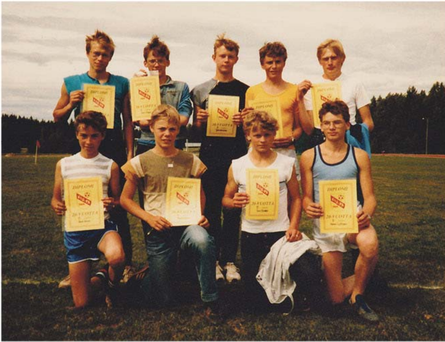
Myöhempien aikojen legendoja vähän uudempina

Ehkä parhaiten jäi mieleen ns. savusaunapalaveri. Peltsun saunassa pidettiin tyypillistä sökönpeluupalaveria, olisko ollu palokunnan vai Kiupan. Väliäkö hällä. Melkein kaikki silloiset brankkarit