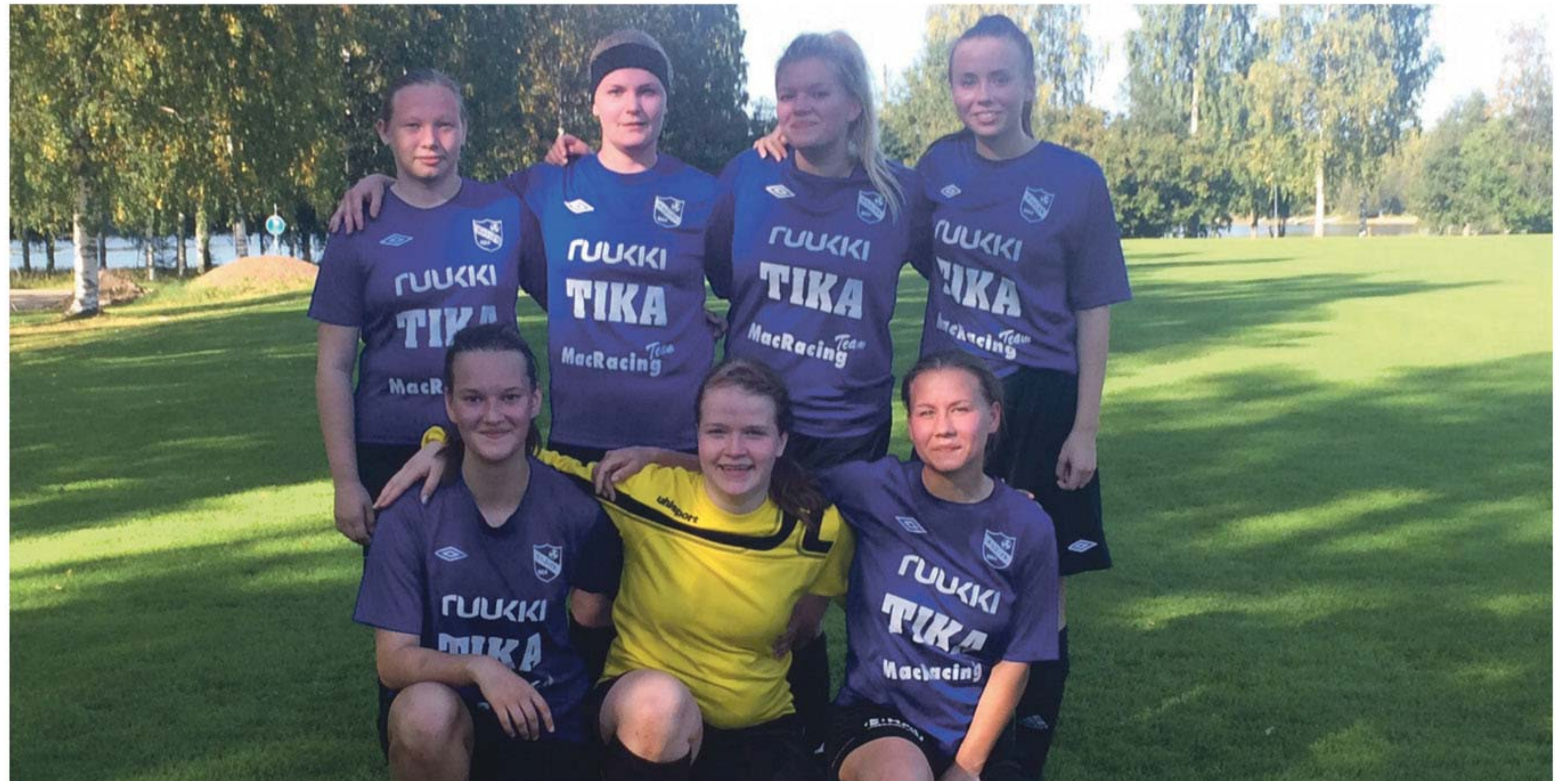
Kauteen 2015 mahtui myös makeita hetkiä. Kuva otettu viimeisen pelin jälkeen, jossa Klubi-36 kaatui Iisalmessa luvuin 3-2.

potti tilannetta. Naisten sijoitus sarjassa kaute-na 2015 oli kuudes. Kauteen 2016 naiset lähtevät uudella innolla. Edellisvuoden tapaan pelataan B-tyttöjen ja naisten yhdistettyä piirisarjaa. Joukkueessa säilyy vanhoista pelaajista vahva runko, mutta myös uusia pelaajia on tulossa. Kaikki jalkapallosta ja naisten joukkueen toiminnasta kiinnostuneet ovat tervetulleita mukaan harjoituksiin.