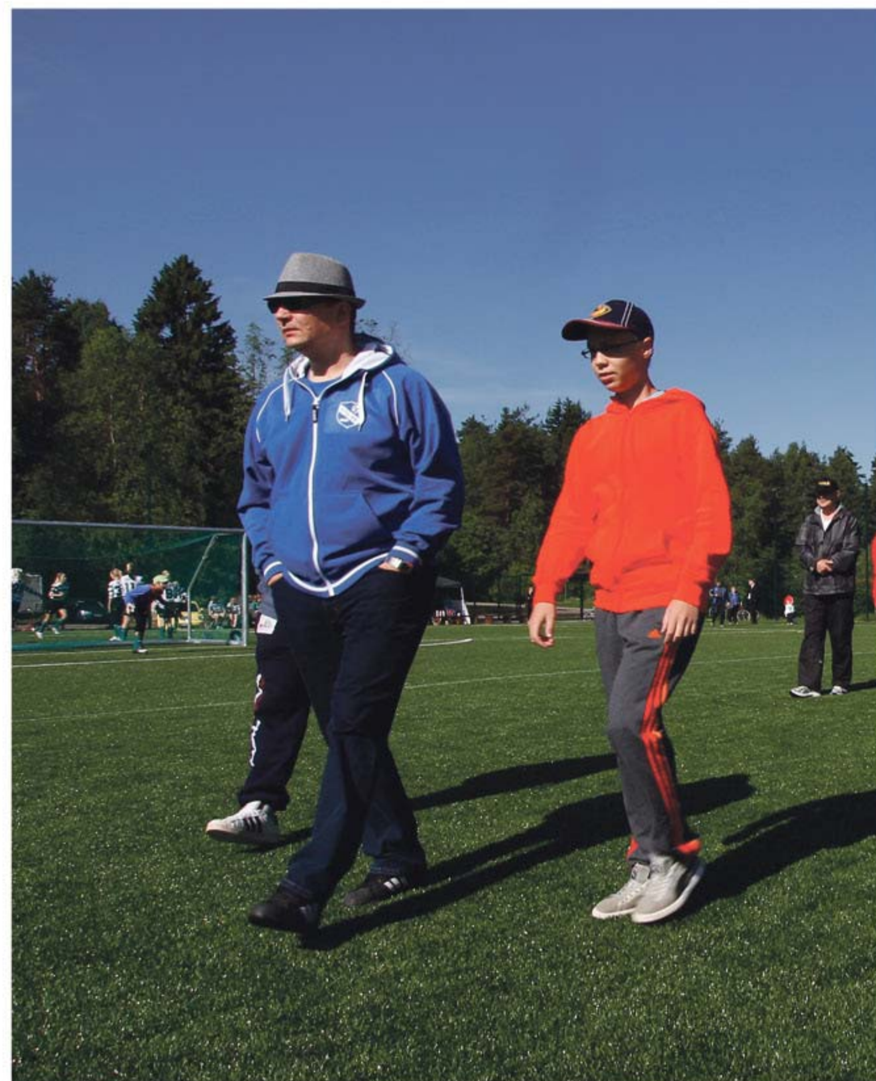
Il Mafioso, Kainu itse.

osas kaatua niin hyvin, vauhtia kun aina oli, että 98 %:sti pallo vietiin pilkulle Kunkun kaatuilusta rankkialueella. Kurkolla kun oli sellainen lähtönopeus, jota ei ehkä ole nähty tänä päivänäkään. Jorma umpivasekkuna vasempana laitalinkkinä sai useammankin kerran muitten syvämmen tyykytyksen nousemaan potenssiin kaksi.