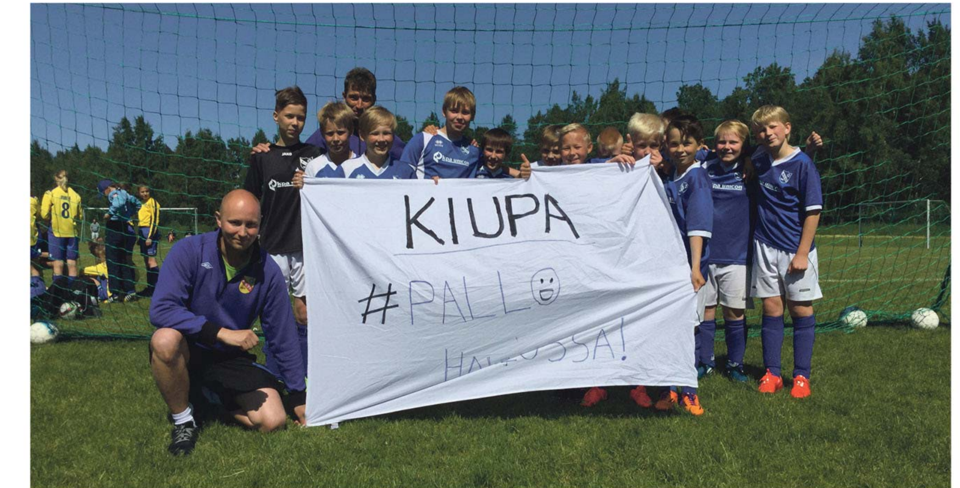
KiuPan 2003 syntyneet pojat nappasivat Vaasacupista kiuruvetisille sopivan sijan : Seitsemäs.