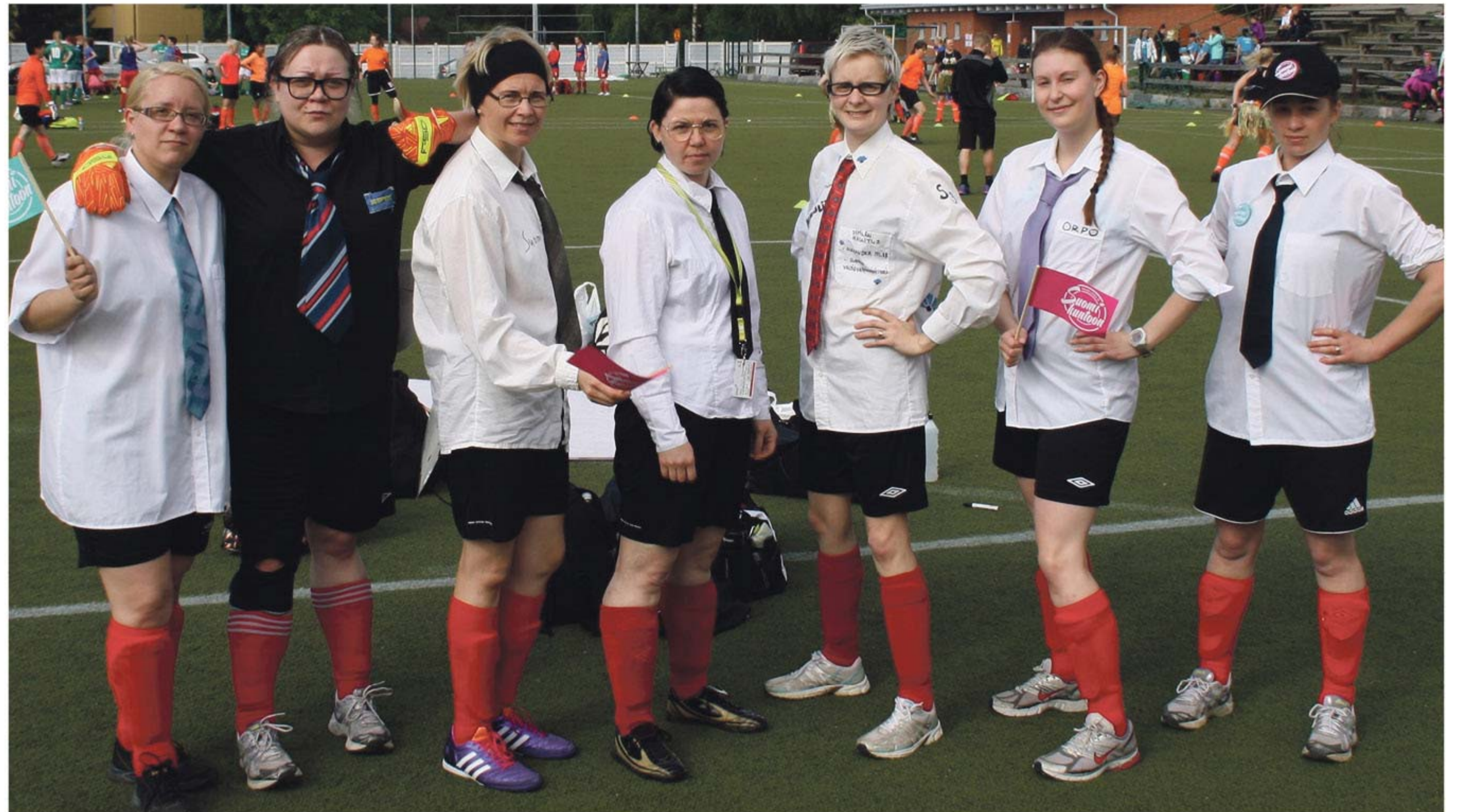
Pukeutuminen kuuluu oleellisena osana NEL -turnausta. Helmien asusteisiin kuului myös hallituskolmikön naamarit.

tetuista tavoitteista osa toteutui. Tärkeintä on, että joukkue on kasassa ja olemme saaneet pidettyä yllä harjoituksia. Suurin ilon aiheemme kaudella oli vahva osallistuminen lempiturnaukseemme, Naati elä laakase, Kuopiossa. Pukeuduimme näyttävällä tyyllillä turnaukseen ajan hengessä, eli Suomen hallituksen jäseniksi. Kun kirjoitan tätä juttua, lumi on vielä maassa. Kuitenkin ajatukset ovat jo tulevassa kaudessa 2016 ja polte päästä kirmaamaan jalkapallokentille on suuri. Otimme malttamattomina varaslähdön kauteen 2016! Järjestimme sunnuntaina 20.3.2016 ystävyysottelun yhdessä Pielaveden naisten