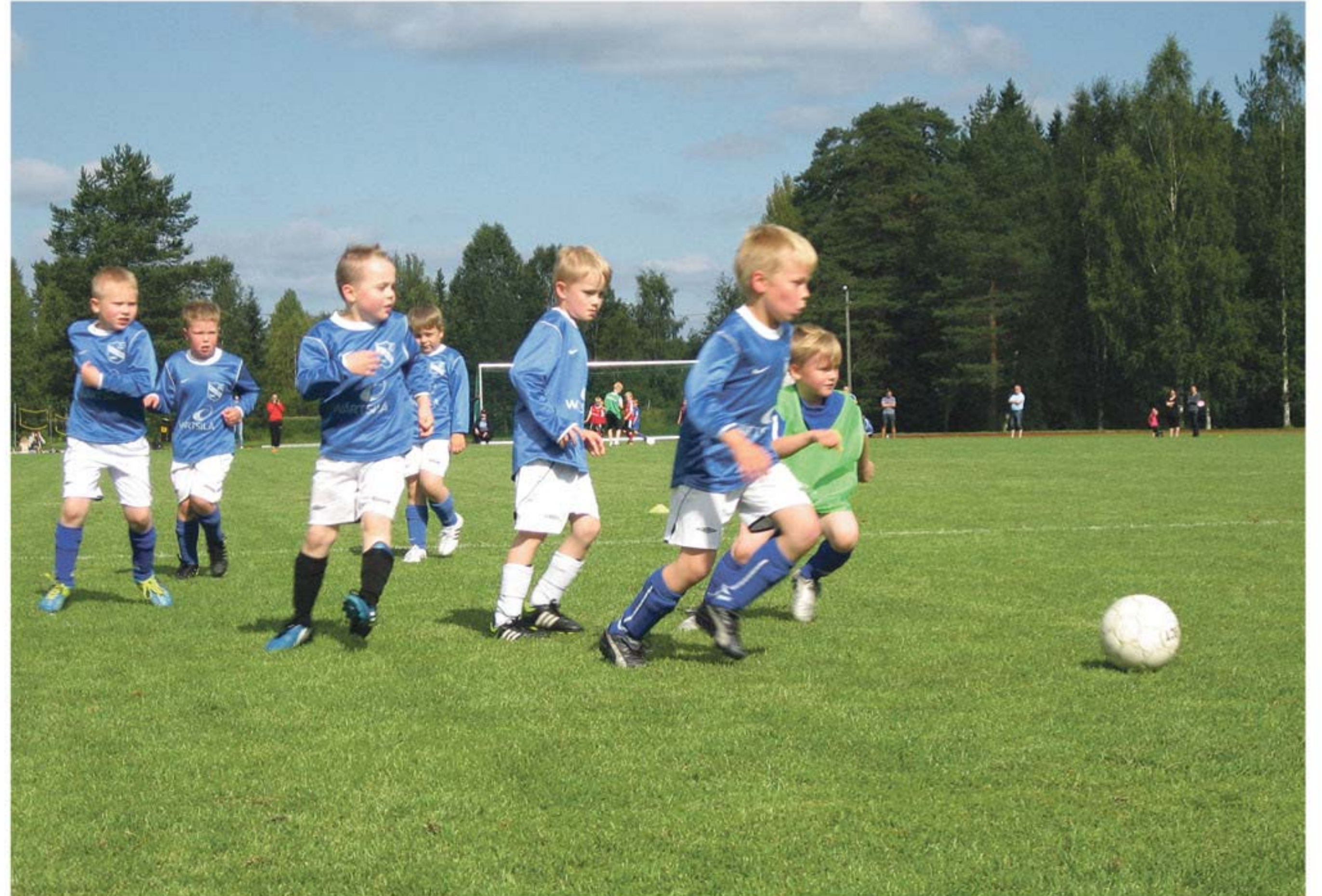
Keskialue tukkoon, pallo haltuun ja hyökkäykseen!