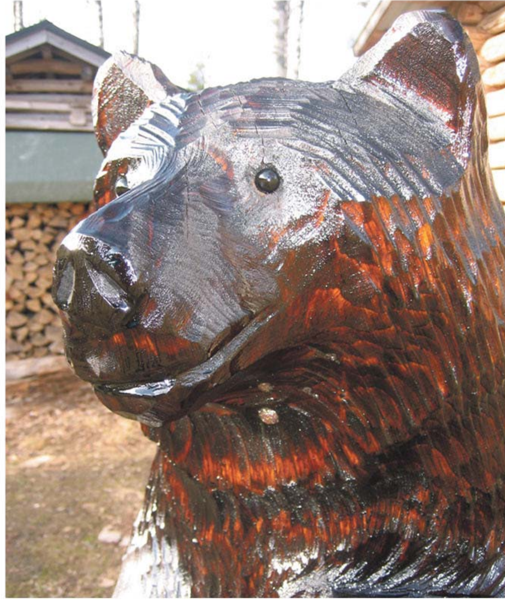
Karhu on jo hereillä ja tähyilee kohti kesän turnausta.

vähintään yhden naispe-laajan kiintiö. Naispuo-