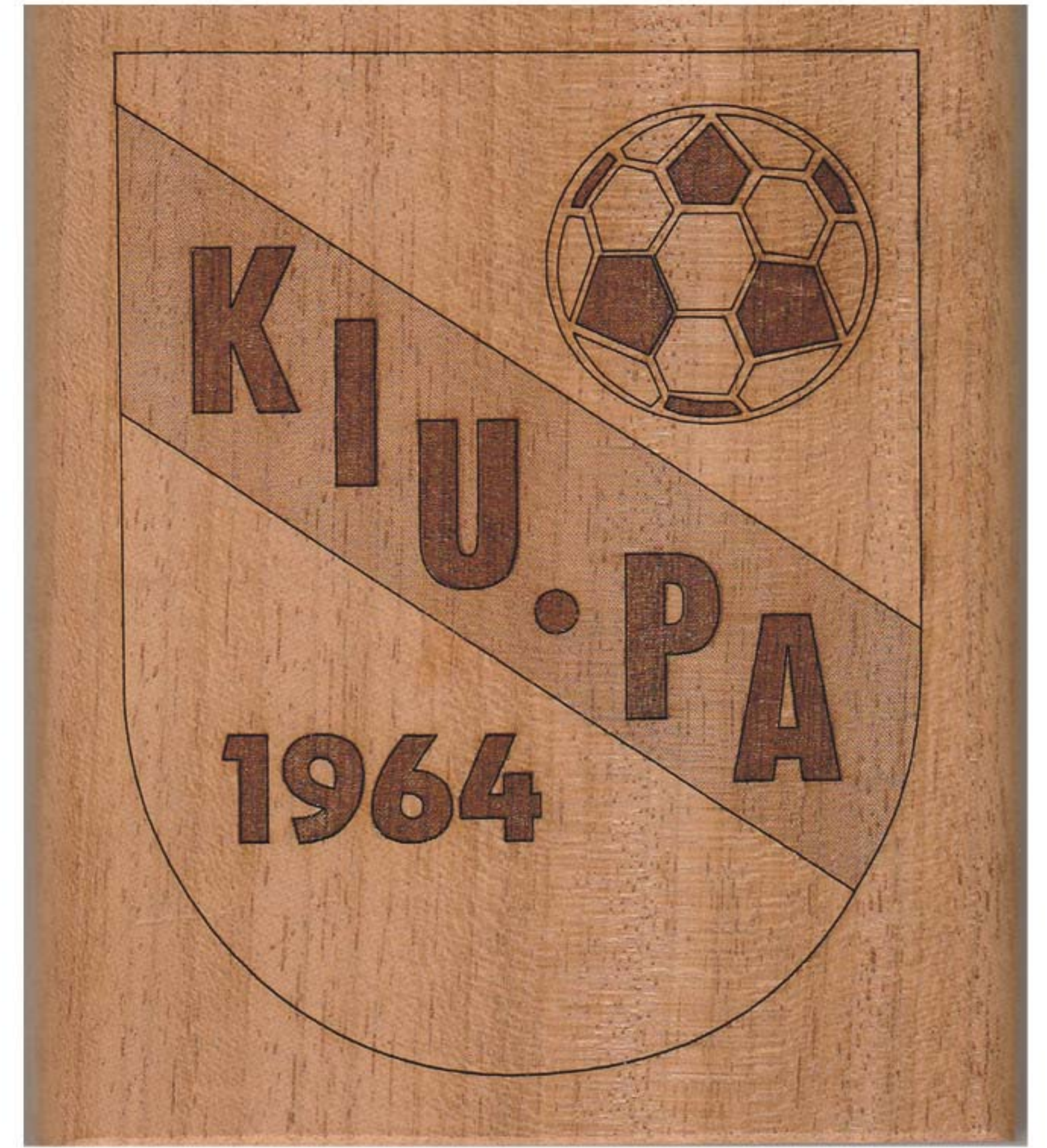
KiuPan vaihtoviiri valmistetaan lämpöpuusta

Lämpöpuusta valmistetut, KiuPan logolla laserkaiverretut, puiset "vaihtoviirit" valmistaa KiuPan logolla varustettuja pal-