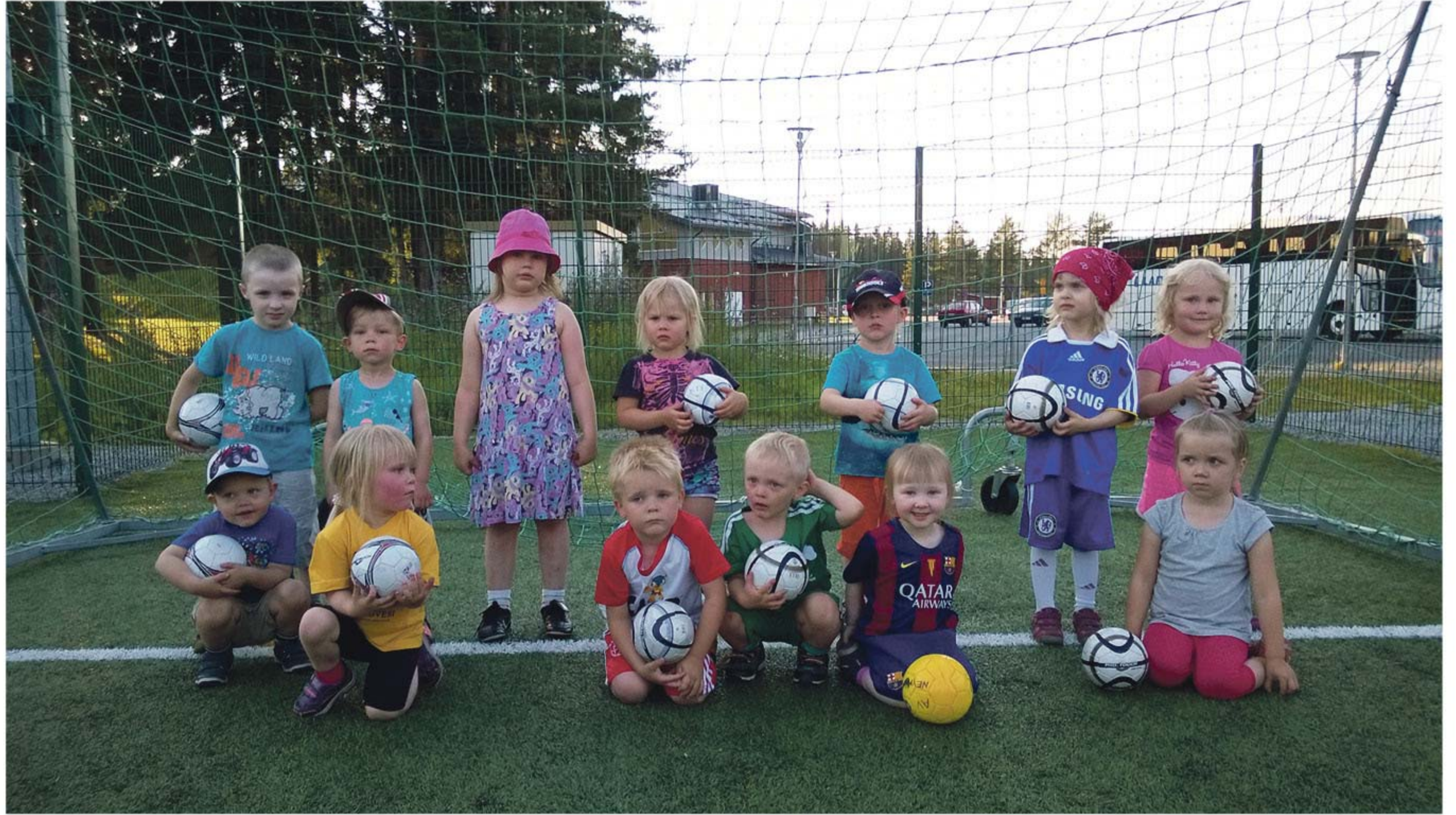
Tästä se lähtee... Kesän 2015 seikkailijat.