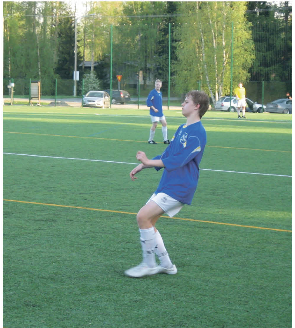
Roosna ei ohjaa pelkästään uutta ikäluokkaa, vaan sukupolvea

Ai niin, mitenkäs ne meidän harjoitus/tal-