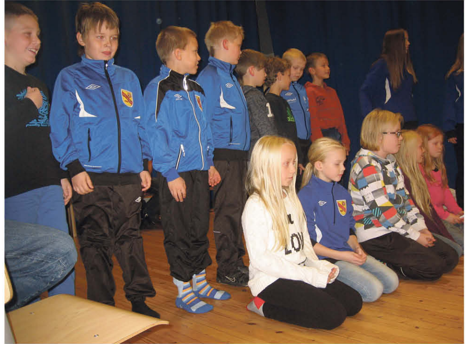
KiuPan 2005 syntyneet kauden päättäjäisissä