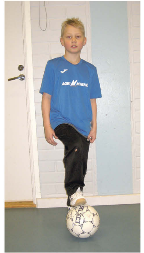
den varojen käytöstä juniorijoukkueiden hyväksi.

Tänä keväänä KiuPa hankki uudet peliasut 2006 syntyneiden junnujen joukkueelle yhteistyössä Agrimarketin sekä pullopalautuksista kertyneiden varojen kanssa. Näin se menee, pienistä puroista kertyy ajan mittaan ihan mukavia puroja. Samalla keräystapa mahdollistaa pienetkin lahjoitukset vaivatta jalkapallojunnujen hyväksi. KiuPan keräysluvassa on nimenomainen maininta kertyneiden varojen käytöstä juniorijoukkueiden hyväksi.