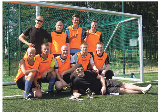
Vuoden 2014 voittaja Kipapo

toiseksi sijoittunutta AC/WC :tä paremman maalieron turvin. Kol-