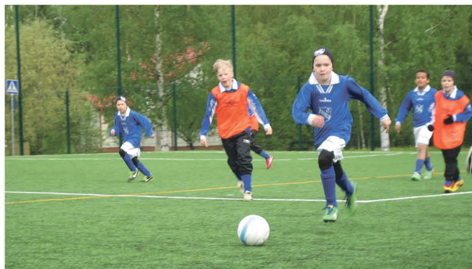
Nollanelosten hyökkäys vyöry

Viime kaudella voittiin ja hävittiin, reilut pelit pelattiin ja paljon uutta opittiin. Tulevalta kaudelta odotamme samaa. Kauteen starttaankin jo tämän pelimuodon ja pallon koon suhteen "konkareina". Ohjatut harjoitukset on kolme kertaa viikossa. Lisäksi kannustamme omatoimiseen harjoitteluun vapaa-ajalla. Pelimme ovat turnausmuotoisia, kaksi peliä per pelipäivä. Pelipäiviä kaudelle kertyy kuusi. Lisäksi pyrimme pitämään harjoituspelejä