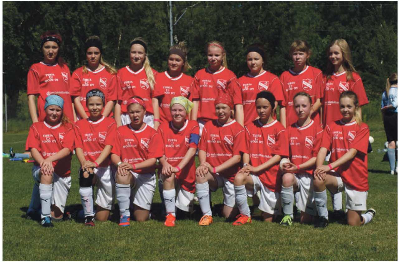
KiuPan C tytöt kesällä 2014

Kaudesta saaliina oli raittiin ulkoilman ja kunnonkohotuksen sekä taitotason nousun lisäksi myös hyvä tuloksellinen taso. Pienkentäsarjasta pokkasimme pronssit kaulaan ja kauden kruunasi oman