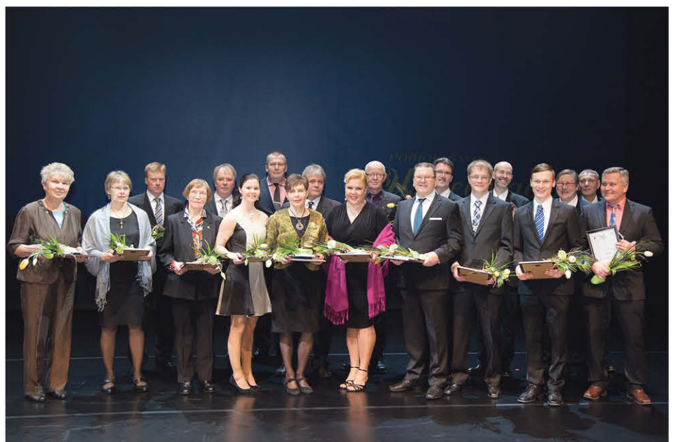
Kuntien vuoden 2014 liikuttajat yhteispotretissa

palkintojen kiilto silmissä tehdäkään, on kuitenkin hienoa että uuteroinnista muistetaan. Samalla puheenjohtaja halusi lähettää kiitoksensa kaikille niille, jotka harrastuksen parissa puurtavat. –Seurajohto pyrkii luomaan puitteet, mutta kyllähän varsinainen toiminta pyörii joukkueissa pelaajien, valmentajien, jojojen, huoltajien kaikkien muiden toimijoiden yhteistyönä.